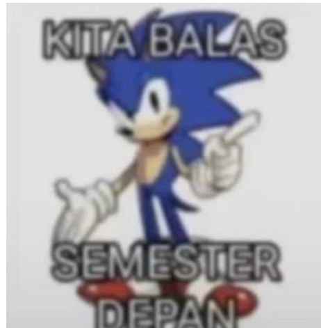
Gambar 3. Meme varian Sonic the Hedgehog - "KITA BALAS SEMESTER DEPAN"